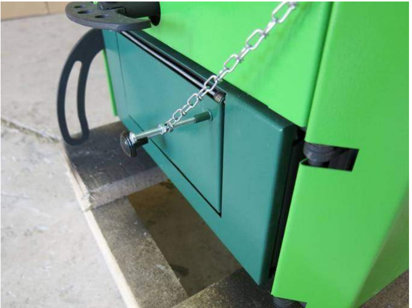
- начало открывания заслонки